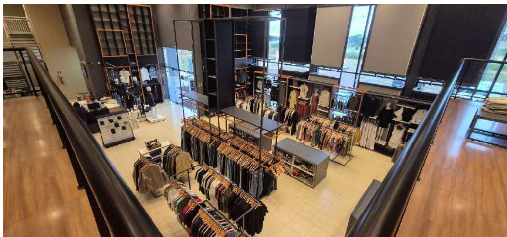
Figura 10 - Interior Parada Beeight