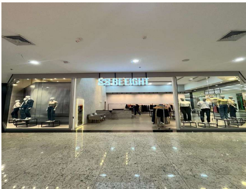
Figura 26 - Fachada loja - Brusque