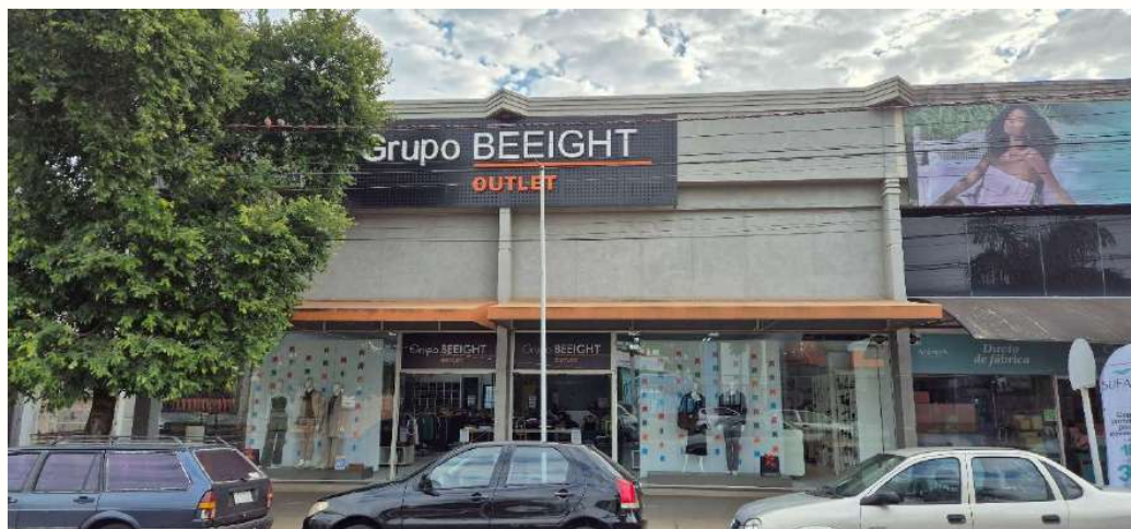
Figura 12 - Beeight loja Av. Paraíba, 1739 - Cianorte