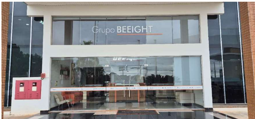
Figura 1 – Fachada matriz Be Eight – Cianorte