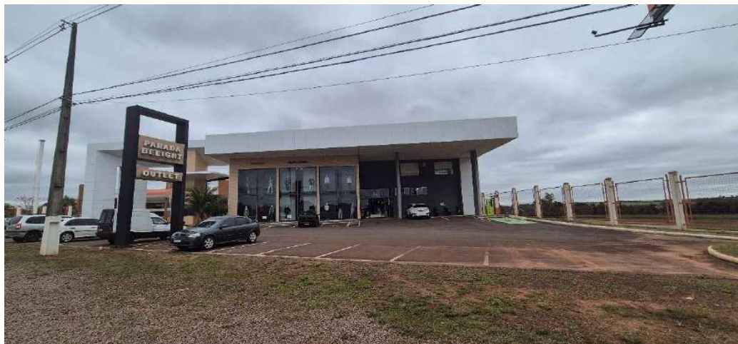
Figura 9 - Fachada Parada Beeight