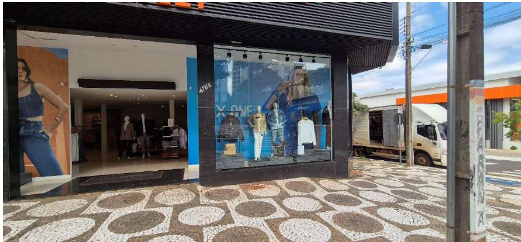
Figura 22 - Fachada loja - Umuarama