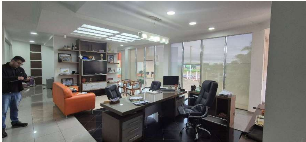
Figura 7 - Diretoria 1