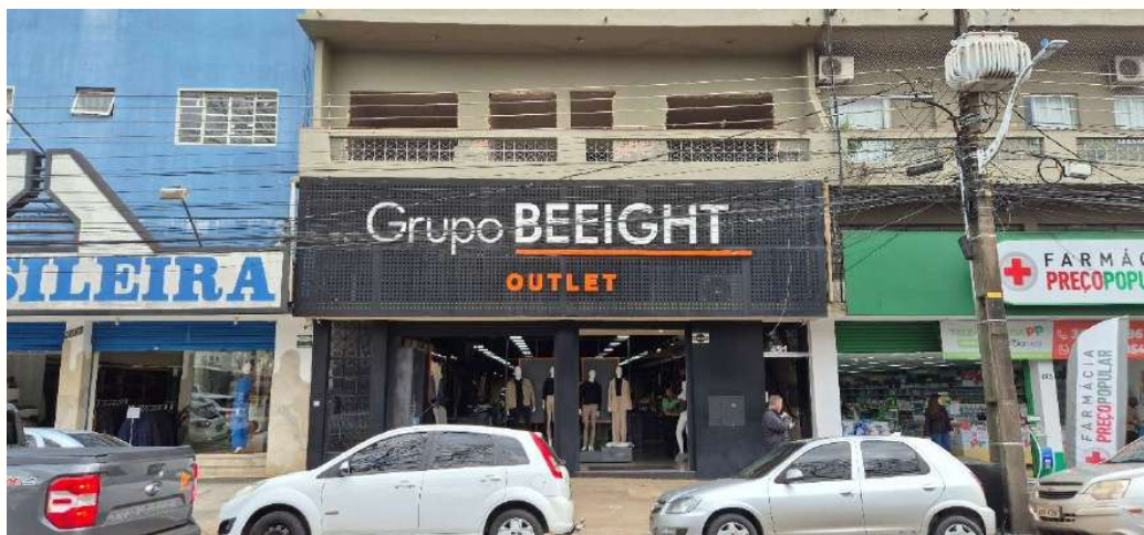
Figura 16 - Fachada loja Av América 2520 - Cianorte