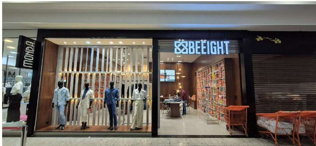
Figura 11 - Beeight loja Master Shopping Atacadista - Cianorte