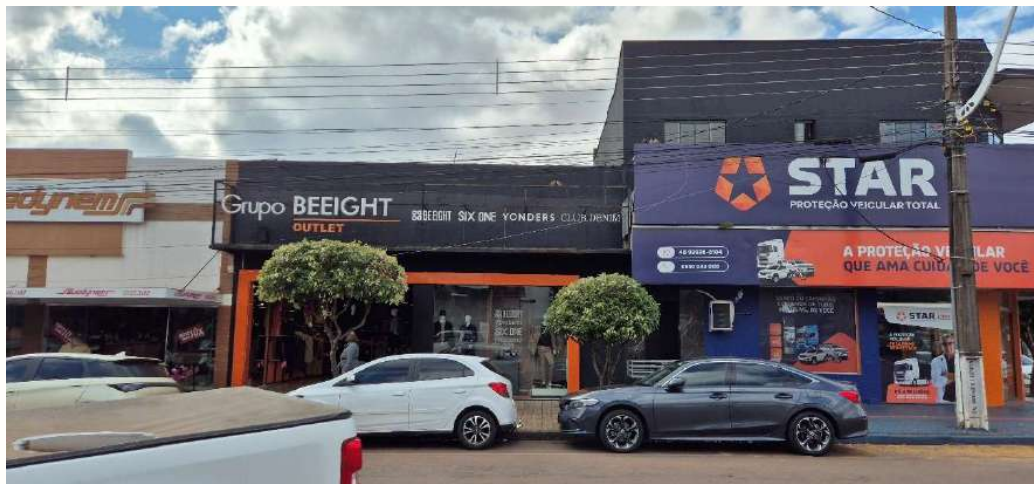
Figura 24 - Fachada Loja - Goioerê