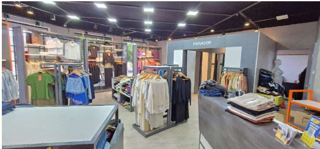
Figura 20 - Interior loja - Terra Boa