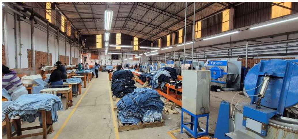
Figura 5 - Lavanderia Industrial