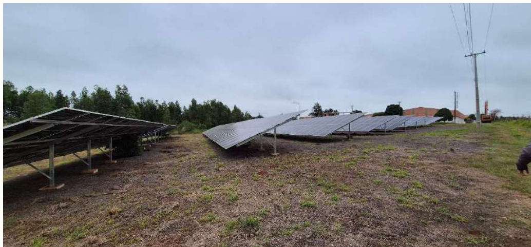
Figura 3 - Usina solar