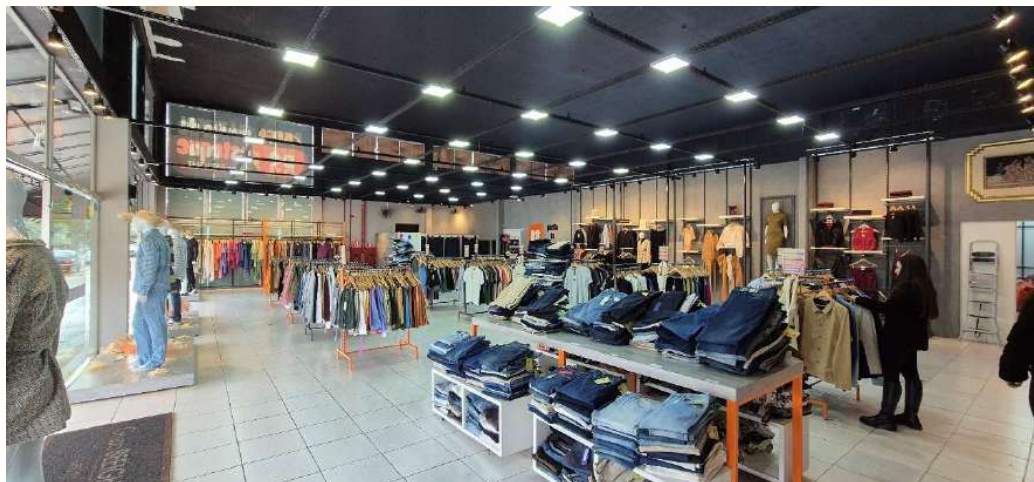
Figura 15 - Interior loja Souza Naves, 495 - Cianorte