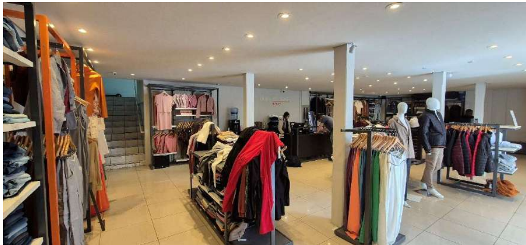
Figura 23 - Interior loja - Umuarama