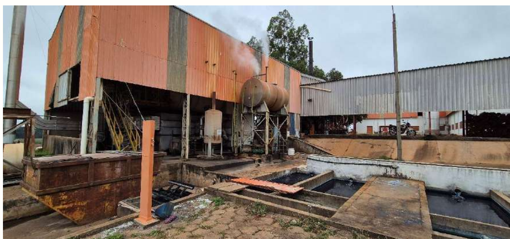
Figura 4 - Caldeira Industrial