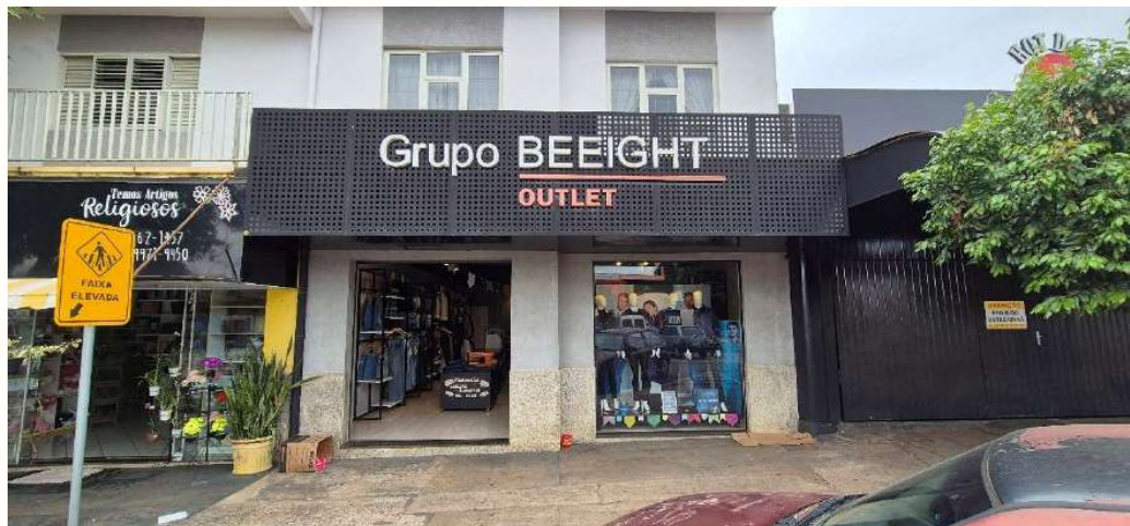
Figura 17 - Fachada loja - Araruna