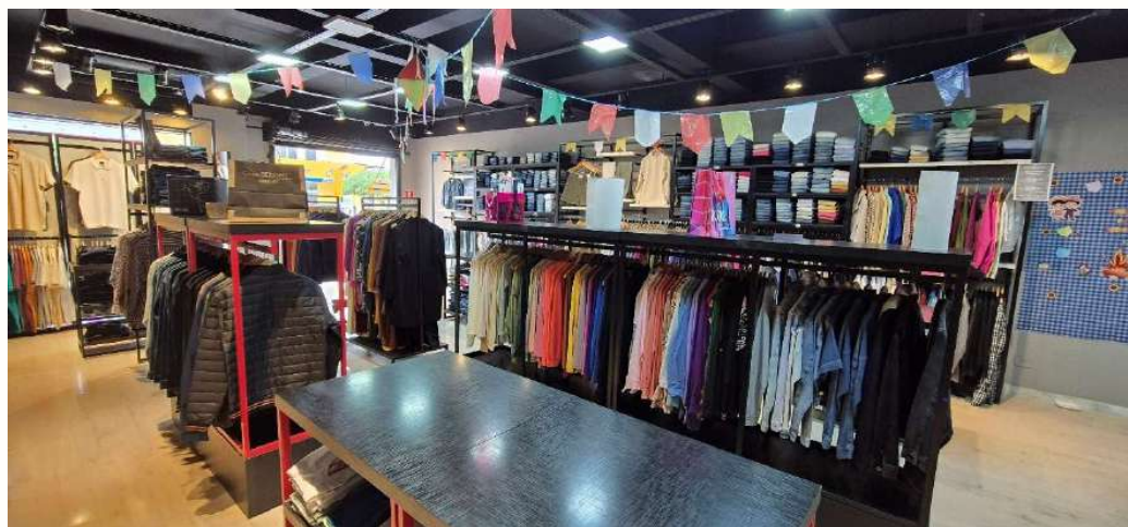
Figura 18 - Interior loja - Araruna