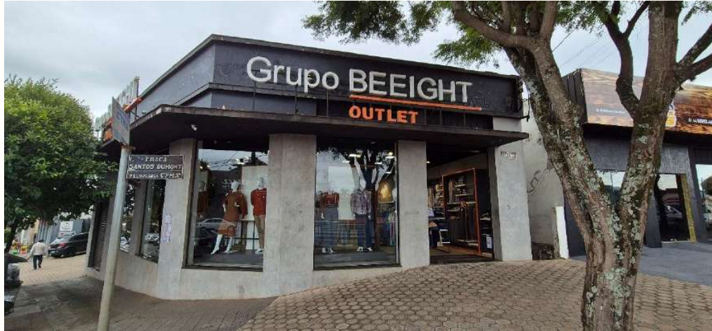
Figura 19 - Fachada loja - Terra Boa