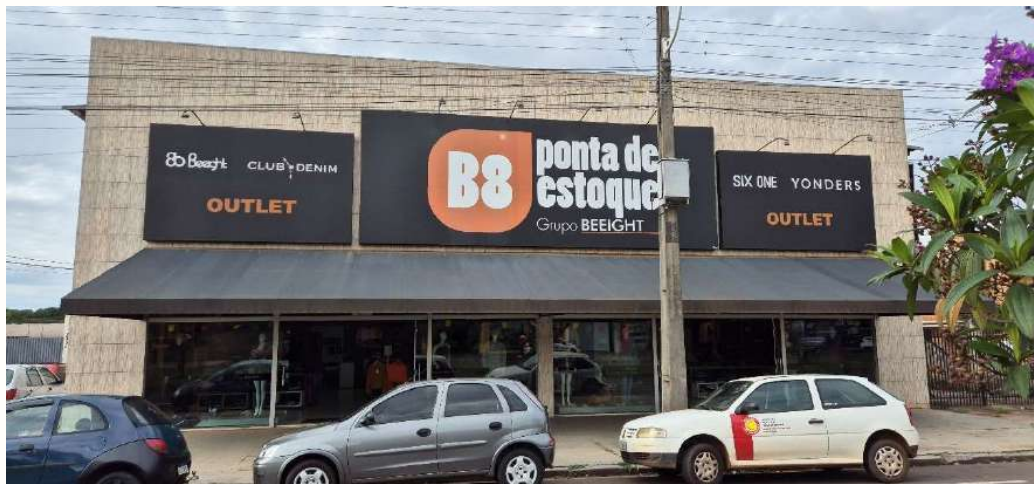
Figura 14 - Fachada loja Souza Naves, 495 - Cianorte