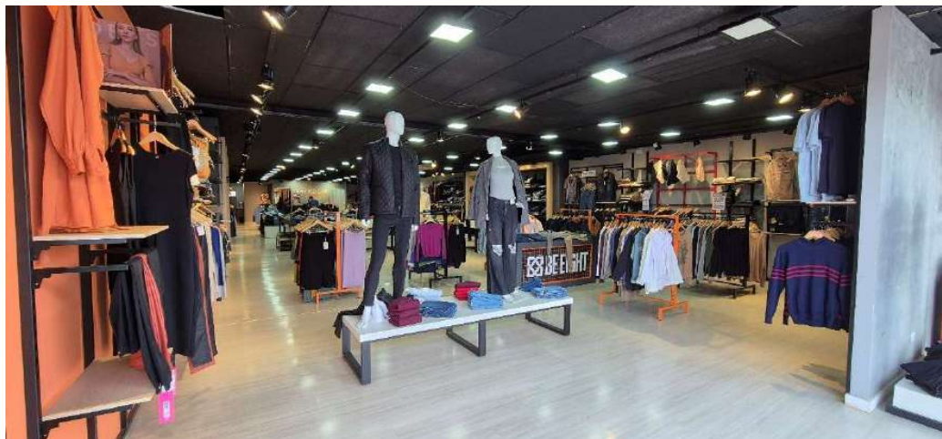
Figura 25 - Interior loja - Goioerê