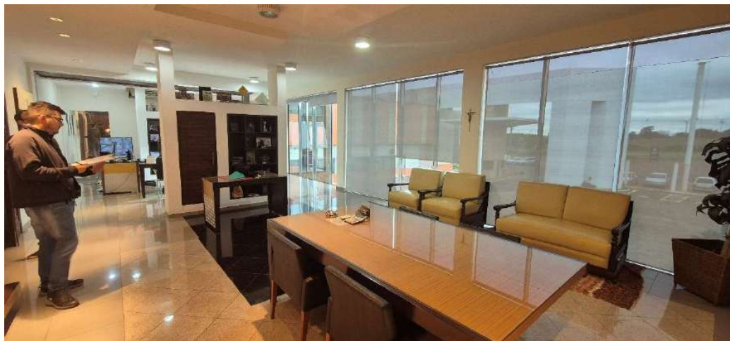
Figura 8 - Diretoria 2