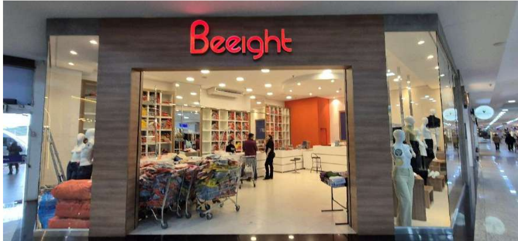
Figura 21 - Fachada Loja Moda Shopping Park- Maringá