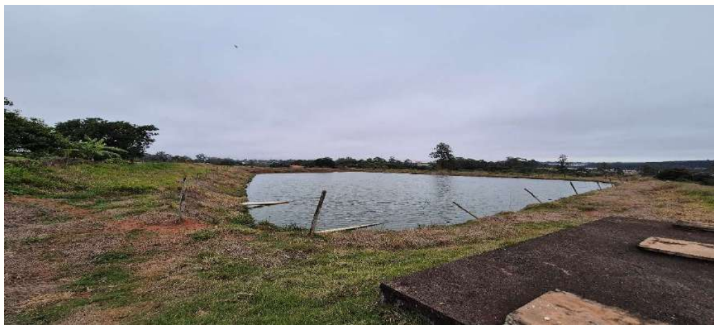
Figura 2 - Lagoa de tratamento