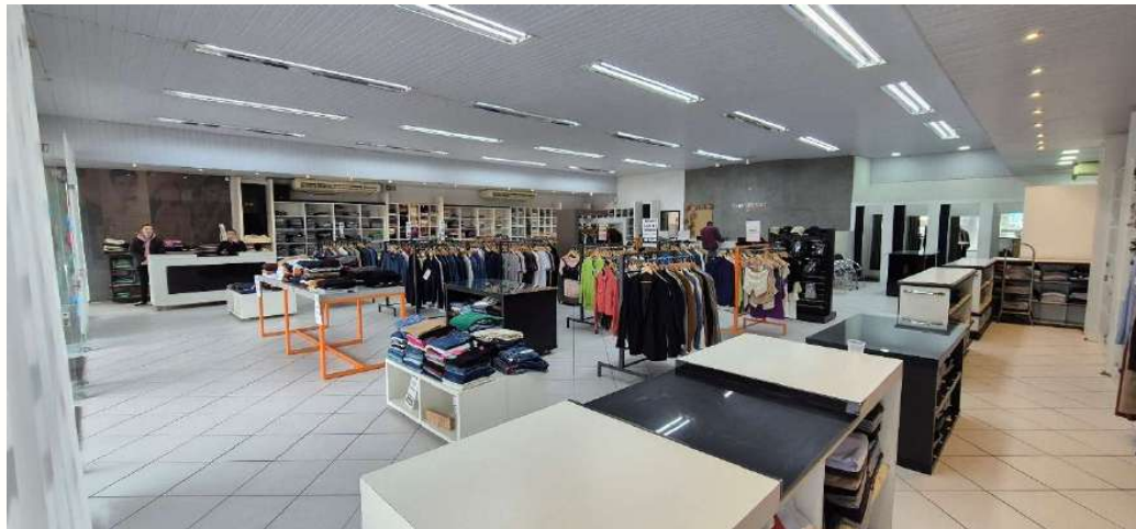
Figura 13 - Interior loja Av. Paraíba, 1739 - Cianorte